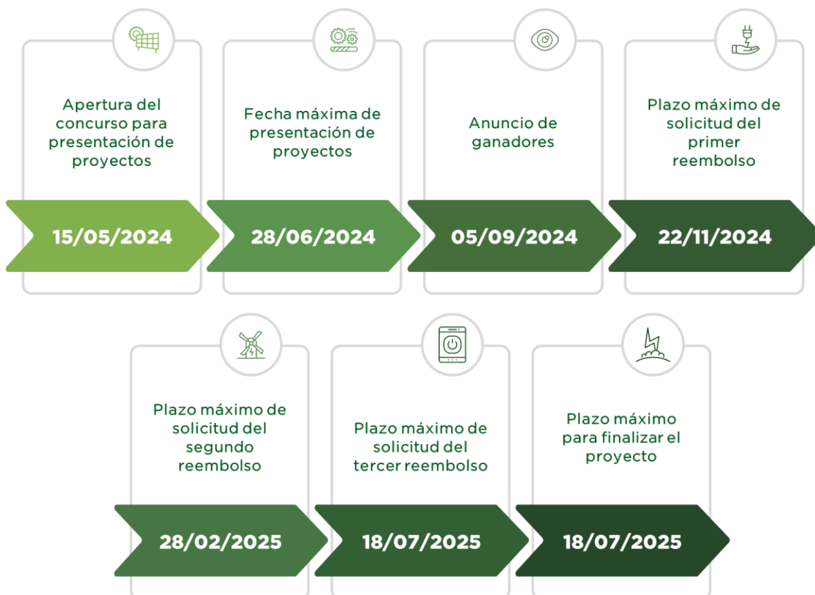
Cuadro 4. Plazos del proyecto

El siguiente cuadro resume los plazos máximos para ejecución de los proyectos de la X Edición del Programa Crecimiento Verde.